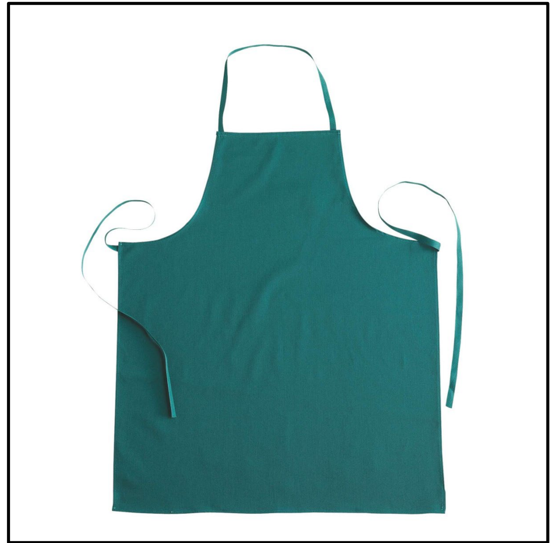
04 - VERDE