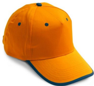
42 – GIALLO/BLU