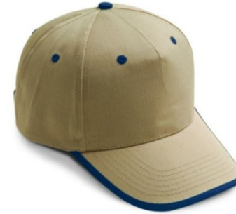
92 – NISIPIU/BLEUMARIN