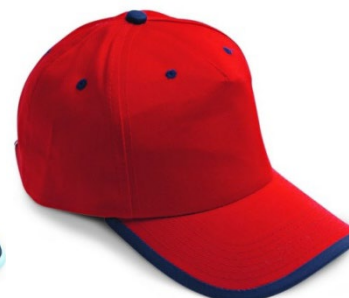
RL – ROSSO/BLU