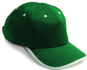
93 – VERDE/BLANCO