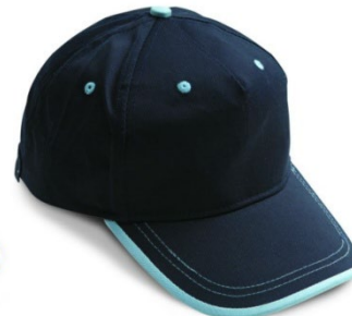
LC – BLEUMARIN/ ALBASTRU DESCHIS