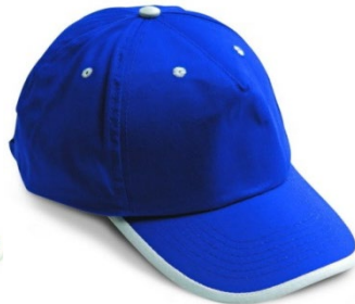
AB – ALBASTRU REGAL/ALB