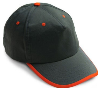
47 – GRIGIO/ARANCIO