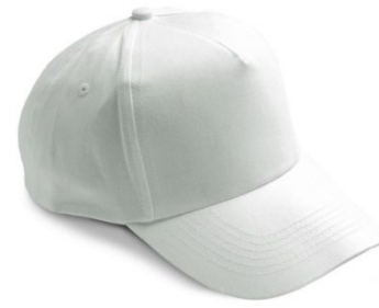
02 – WHITE