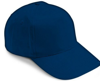
01 – BLU

Berretto con chiusura posteriore con velcro con regolazione di misura, quattro fori di aerazione ricamati con filo di colore in tinta, composto da cinque pannelli, pannello frontale rinforzato.