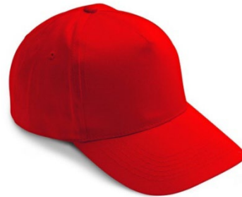
07 – ROJO