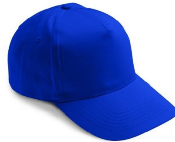
06 – ALBASTRU REGAL