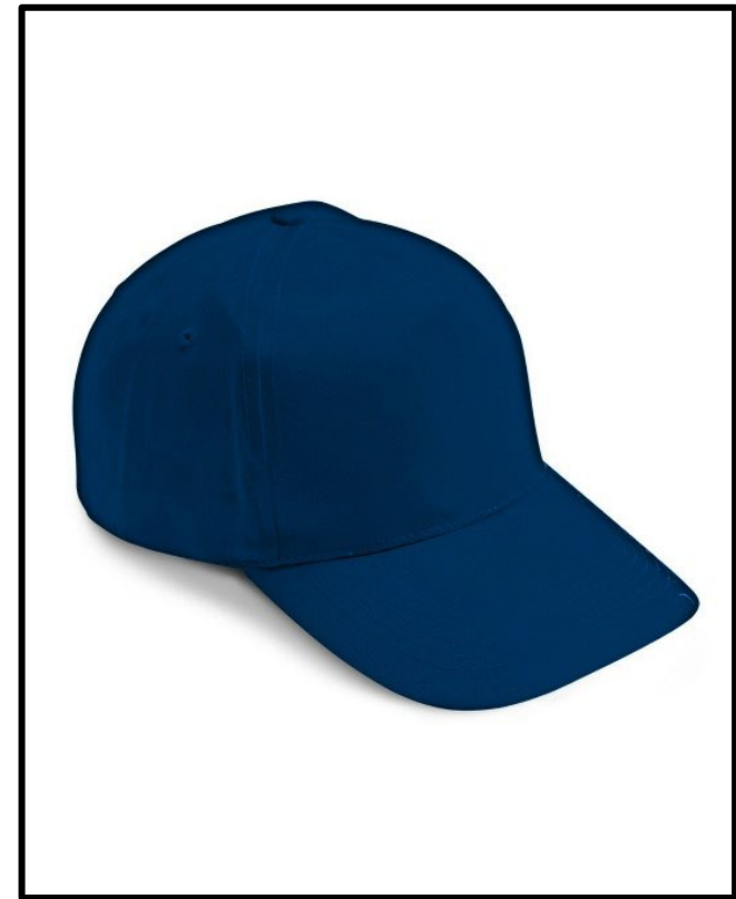
01 – BLU