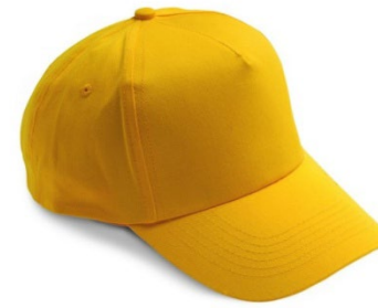
08 – GIALLO