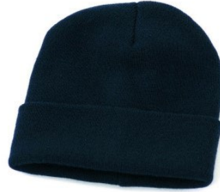
01 – BLU

DESCRIZIONE Cappello doppio strato con risvolto.