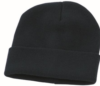
05 – NERO