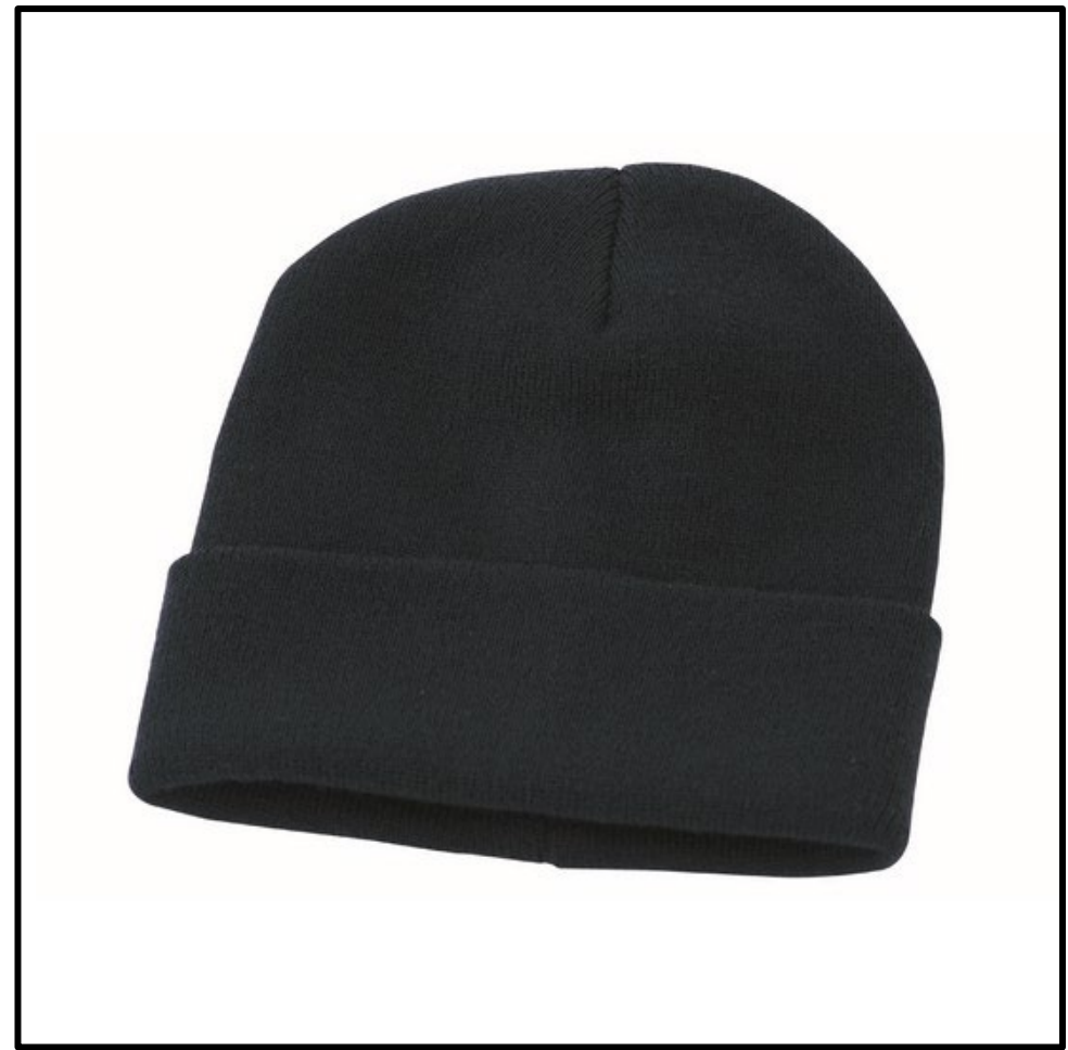
05 – NERO