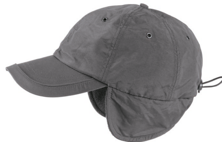
12 – GRIGIO