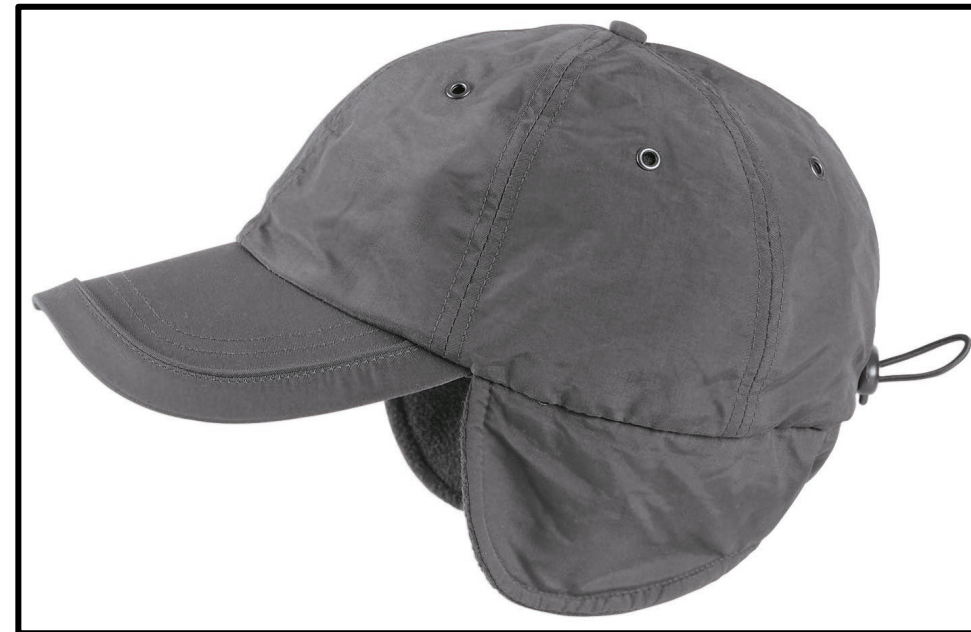
12 – GRIGIO